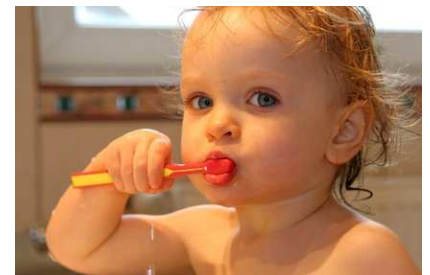
Kinder zum regelmäßigen Zähneputzen zu erziehen, ist nicht immer einfach. Deshalb unterstützen wir Sie dabei. Wie? Das erfahren Sie auf der nächsten Seite!

Lassen Sie es nicht zu lange an Flaschen mit Fruchtsäften nuckeln und verdünnen Sie diese mit Wasser. Gewöhnen Sie Ihr Kind von vorneherein an regelmäßige und gründliche Zahnpflege.