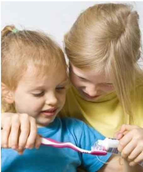
Früh übt sich: Richtige Mundpflege schon ab dem ersten Zahn. Wir zeigen Ihren Kindern, wie es geht.